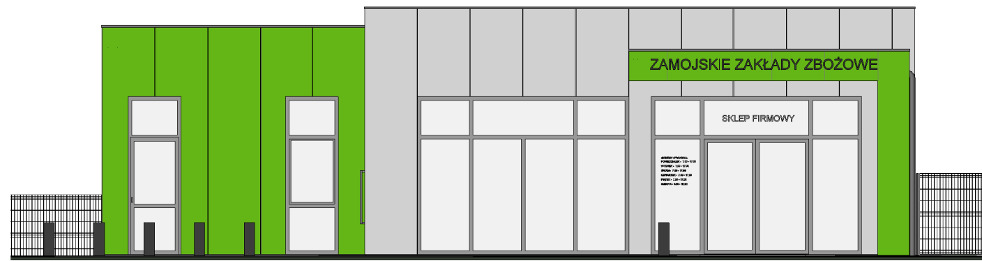
1 Południe 1 : 100