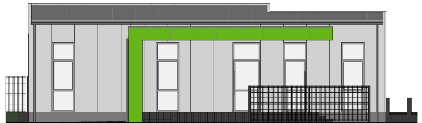
2 Północ 1 : 100